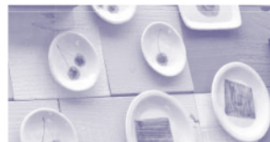
器に絵付けをしよう