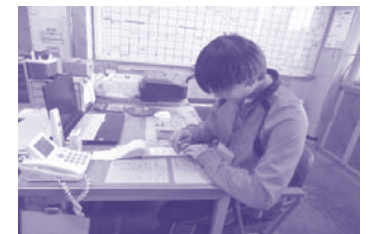
青少年研修センターでの様子