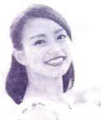
田村 麻理子 (歌手・ミュージカル女優)