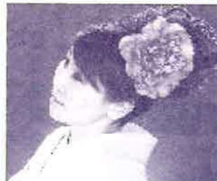
翔田ひかり(唄・津軽三味線)