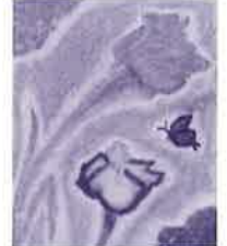
写生大会金賞受賞作品