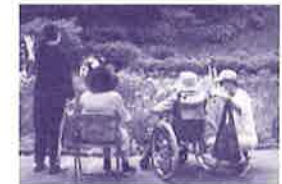
写真コンテスト金賞受賞作品