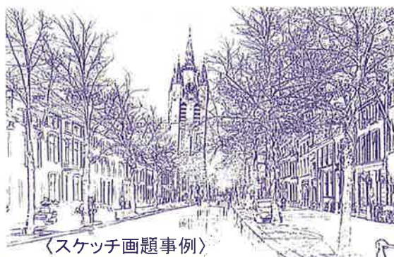
〈スケッチ画題事例〉

日時: 毎月第一週月曜日(原則) 午前9時 ~ 11時30分 場所: 青少年研修センター 研修室