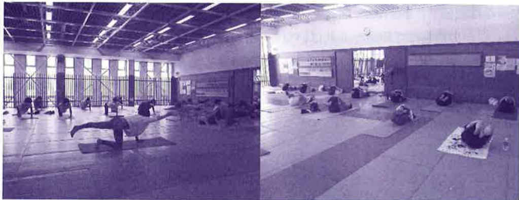
〈骨盤底筋ヨガ教室〉レッスンの模様

4月から新しく始まりました振興会主催の「骨盤底筋ヨガ教室」が、6月に閉講しました。骨盤を中心に全身を整え、芯のあるしなやかなボディラインをつくるレッスンを行ない、毎回期待と楽しみに講座を受講されました。受講生の皆さんは、「身体の痛みが軽減し、活動の幅が広がった」「体のゆがみが改善した」など思い思いの達成感が得られ、「次回もぜひ参加したい」というご意見も多数いただきました。今後も継続していきたいと思えます。