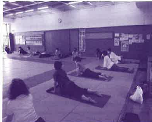
〈心とカラダのヨーガ〉