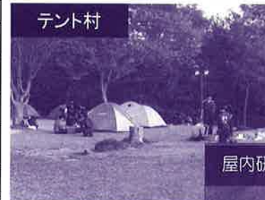
※( )内の金額は、小中学生を 対象とする料金です。