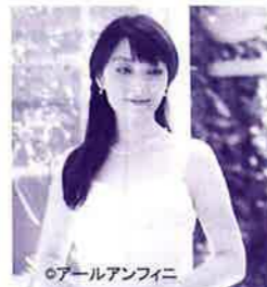
○オールアンフィニ

チケット前売所 亀山市文化会館、亀山エコ一案内所、NPO 法人亀山音楽協会、亀山市観光協会、フジヤ 他