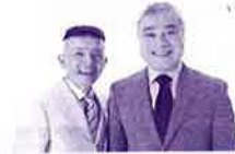
西川のりお・上方よしお