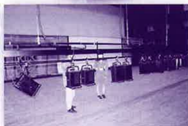
文化会館照明設備の操作体験中