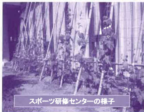
スポーツ研修センターの様子

日時:平成30年7月20日(金)~25日(水) 場所:亀山市文化会館大ホールロビー