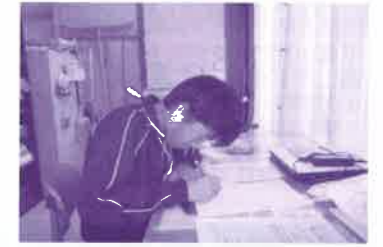
スポーツ研修センターにて事務作業

振興会では、学校では体験できない就業を経験していただ き、人間力の強化や今後の進路の決定等に少しは貢献でき ればと考えています。