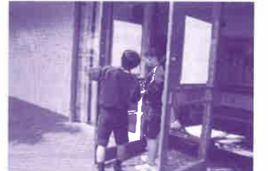
亀山市文化会館にてポスター貼り