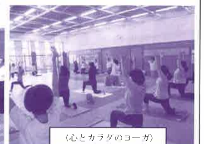
(心とカラダのヨーガ)